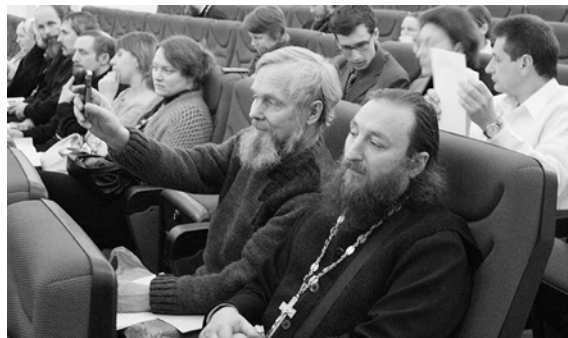
В зале конференции.

помочь каждому конкретному человеку, который обращается к тебе за помощью.